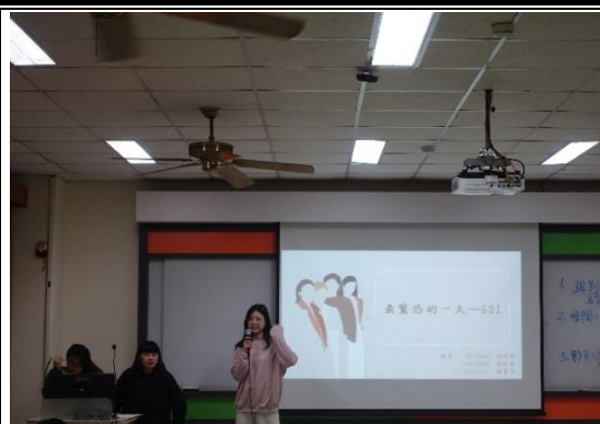
學生期末報告分享恐怖攻擊相關議題