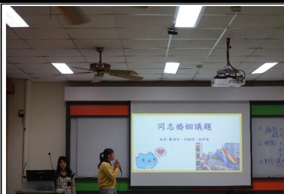
學生期末報告分享同志婚姻相關議題