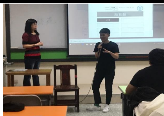
學生課堂分享對於媒介識讀之看法