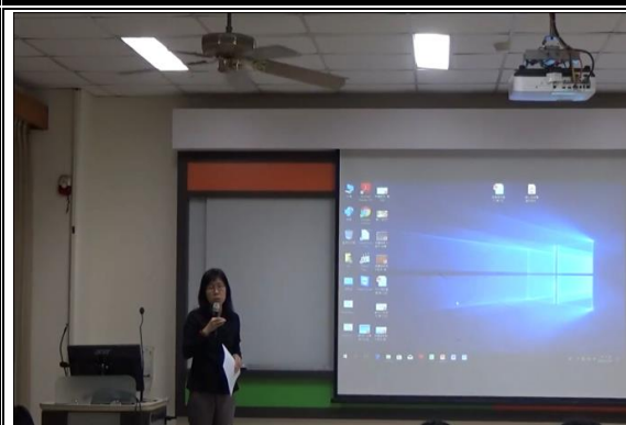
授課教師對於學生報告內容做講評