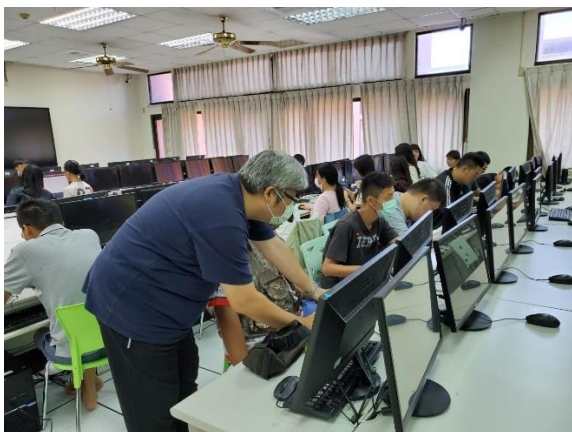
同學們分組討論的情況 5