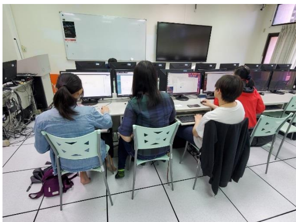
同學們分組討論的情況 1