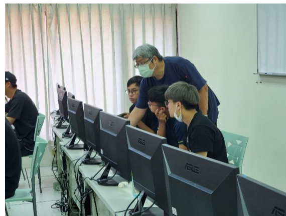
同學們分組討論的情況 6