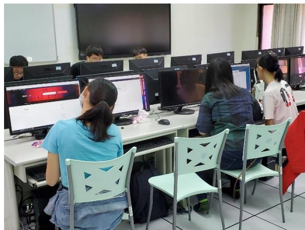
同學們分組討論的情況 2