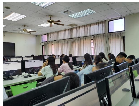
同學們分組討論的情況 4