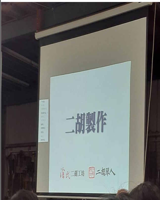
二胡製作地點，二胡琴人