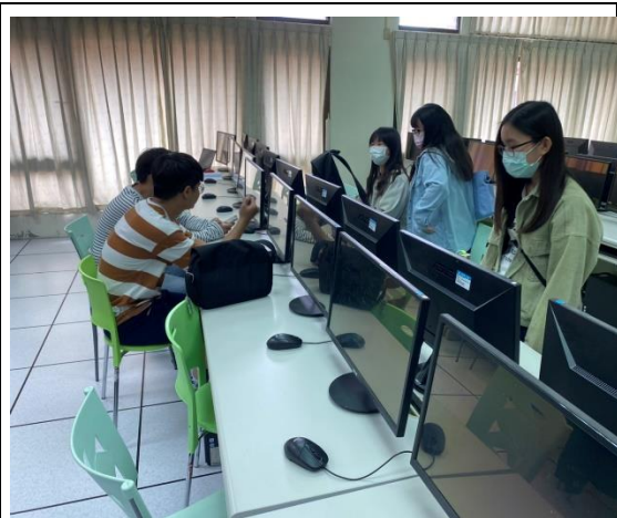
同學們各組討論的情形 3