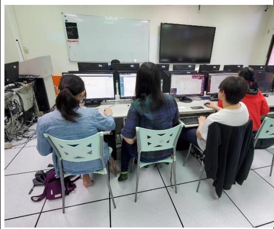
同學們分組討論的情況