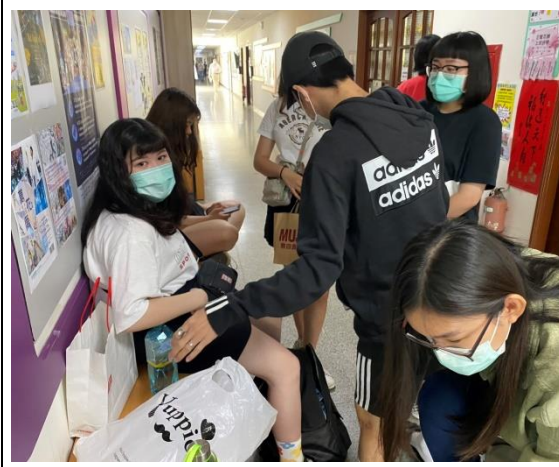
同學們往另一間教室移動並討論