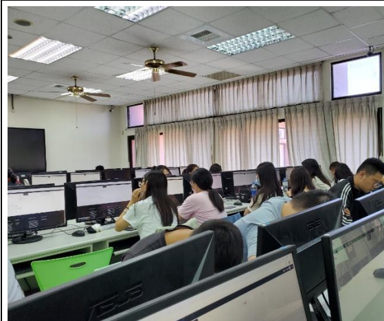
同學們各組討論的情形 2