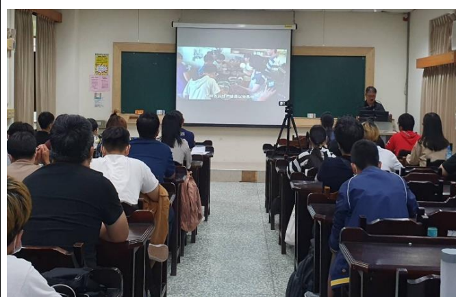
播映影片進行講解