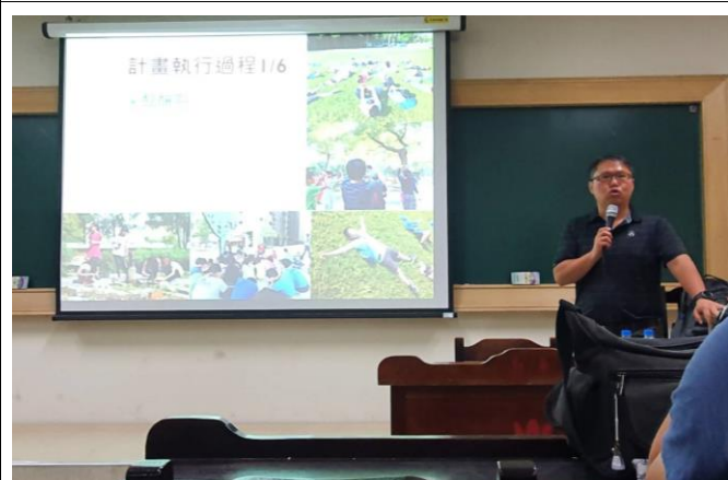
計畫執行過程與成果展現