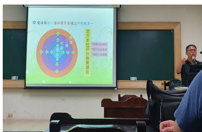
說明媒體與戶外實踐的教育結合