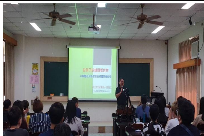
活動講師的經歷介紹