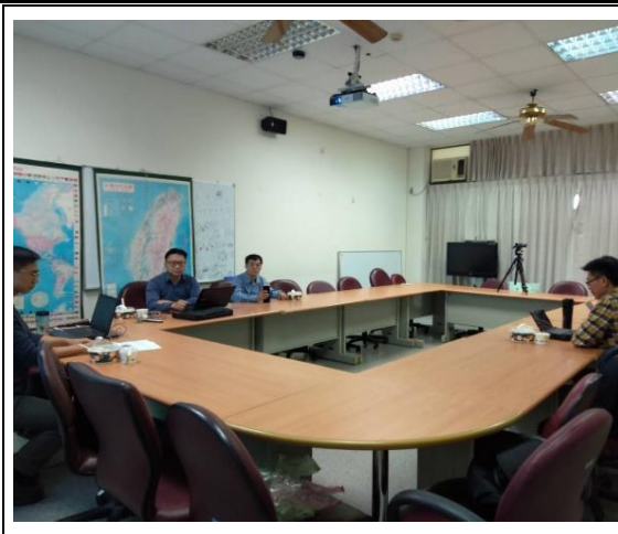
2019/12/13 AI 選情分析教師課程