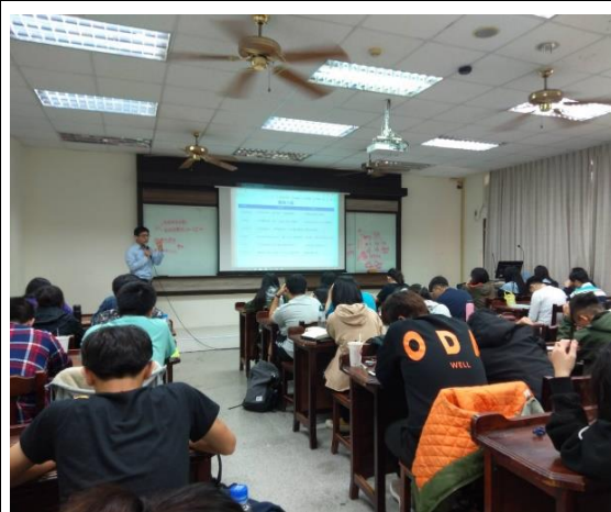
2019/12/23 “希奇傳奇” 講座