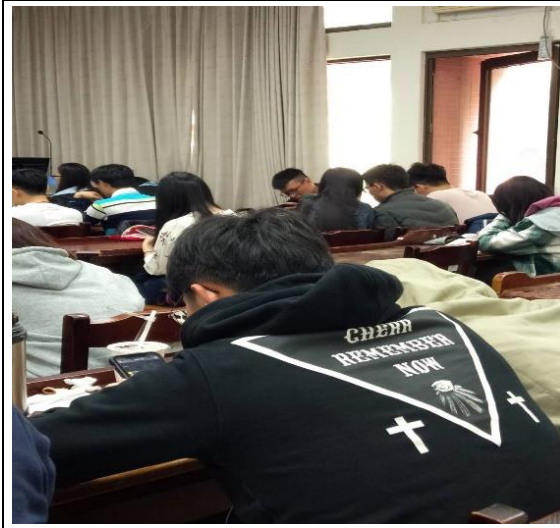
2019/12/23 “希奇傳奇” 學生討論