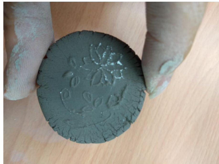
印刻花紋於陶土上